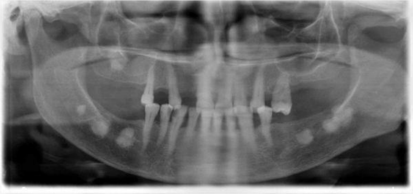
Resim 2. Florid semento-osseöz displazi vakasının panoramik radyografideki görüntüsü