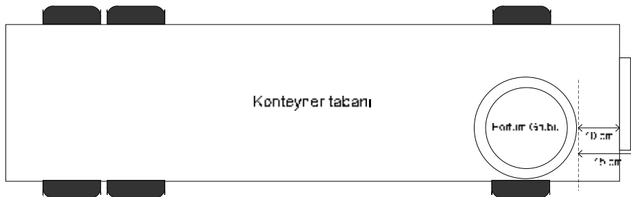
Şekil 2. Konteyner yükleme problemi için mutasyon operatörü

Uygulamamızda çaprazlama operatörü olarak tek nokta çaprazlama ve mutasyon operatörü olarak da konteyner yükleme problemine özgü oluşturulan bir mutasyon operatörü kullanılmıştır. Buna göre mutasyon yapılmasına karar verilen (algoritma içerisinde belli bir olasılıkla belirleniyor) hortuma ait koordinatlar belli kurallar dikkate alınarak değiştiriliyor. Bu kurallar hortumun konteyner taban alanının dışına çıkmasını engelleyen kurallar olarak uygun olmayan çözümlerin elenmesini sağlamaktadır. Koordinatlardaki değişikliklere, belirlenen değişim (cm cinsinden) ile gerçekleştirilebilecek değişimden minimum olanının seçilmesi ile karar verilmektedir. Örneğin hortum grubu x koordinatında sağa doğru 10 cm kaydırılabilecekse ve tesadüfi olarak belirlenen sağa kaydırma parametresi 15 ise değişiklik sağa doğru 10 cm olarak gerçekleştirilmektedir (Şekil 2).