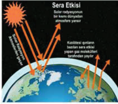
Şekil 1. Sera etkisinin dünya üzerindeki oluşumu [10]