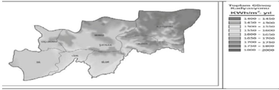
Şekil 3. Şırnak ili güneş haritası

Güneş enerjisinin avantajlarına gelince, bir defa taşınabilirlik avantajı var ve çevre dostudur. Dezavantajı ise, başlangıç maliyetleri maalesef çok yüksek ve henüz istenen teşviklere sahip değil.