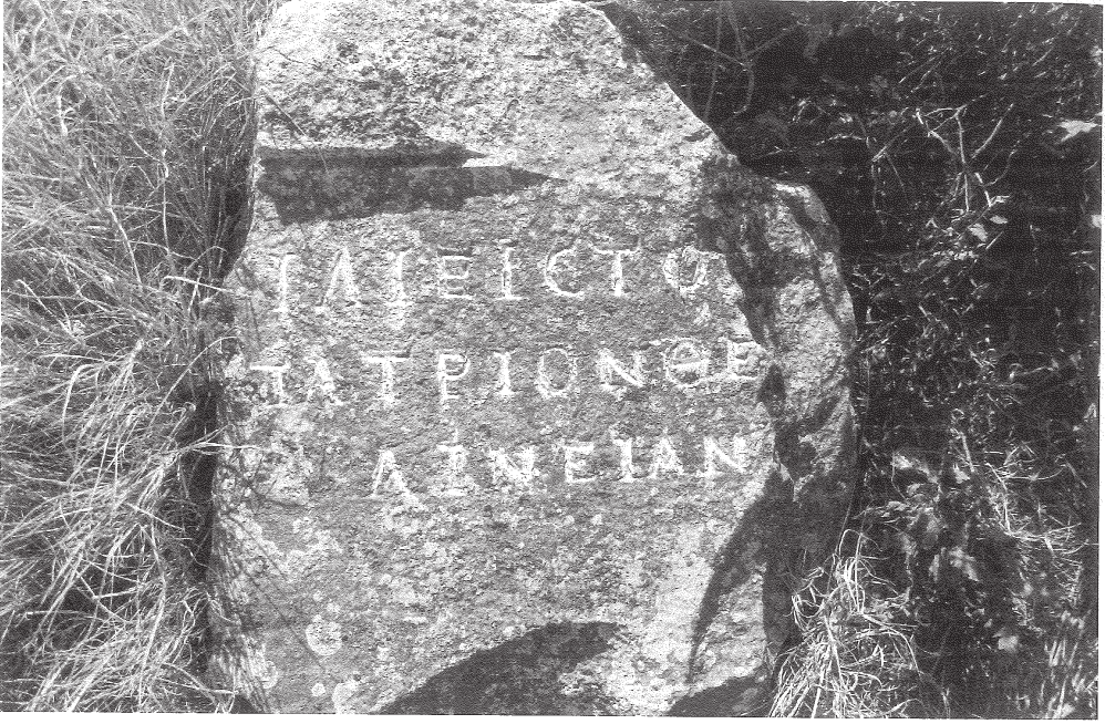
Res. 3 Halileli Köyü Mezarlığı, mermer kaide parçası. Fig. 3 Cemetery of Halileli village, fragment of a marble base.