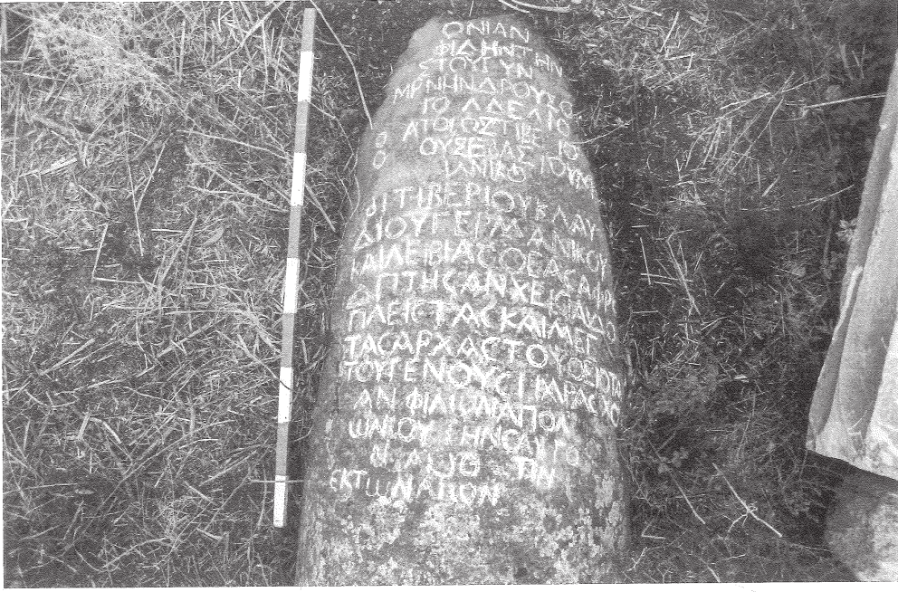
Res. 1 Halileli Köyü Mezarlığı, Genç Antonia için onurlandırma yazıtı. Fig. 1 Cemetery of Halileli village; Honorary inscription for young Antonia.