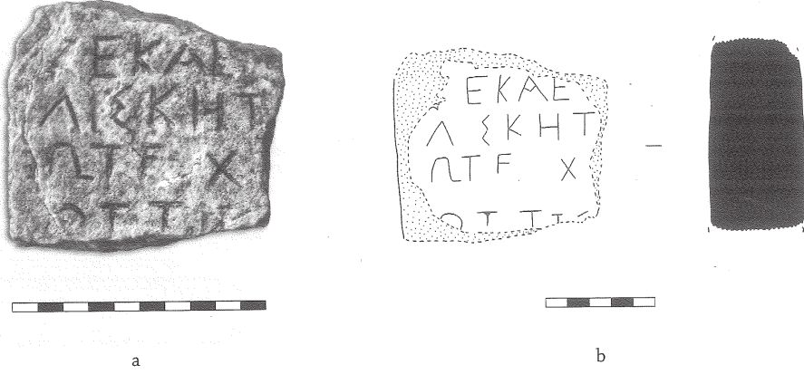
Res. 7a-b Harmangöğsü yazıt parçası. Fig. 7a-b Harmangöğsü, fragment of an inscribed block.