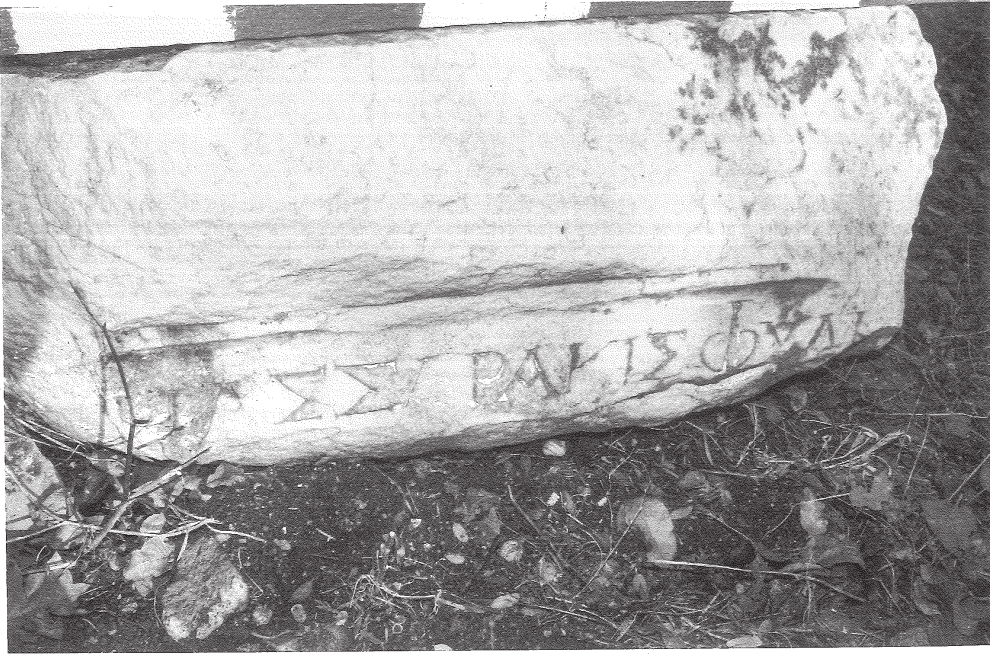
Res. 8 Dedemezarlığı Mermer kaide parçası. Fig. 8 Cemetery of Dede. Fragment of a marble base.