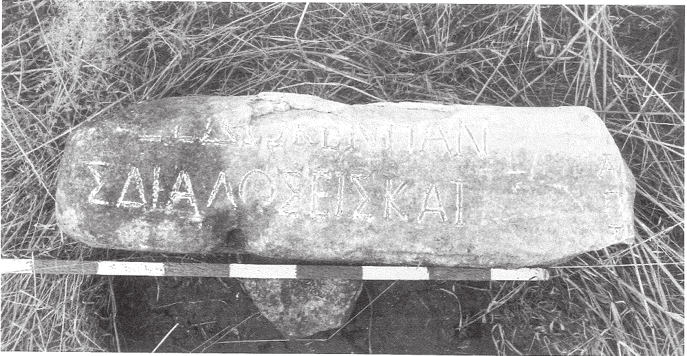
Res. 4 Halileli Köyü Mezarlığı, yazıtlı blok parçası. Fig. 4 Cemetery of Halileli village, fragment of an inscribed block.