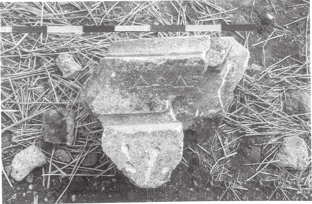
Res. 6 Dardanos, yazıtlı sunak parçası. Fig. 6 Dardanos, fragment of an inscribed altar.