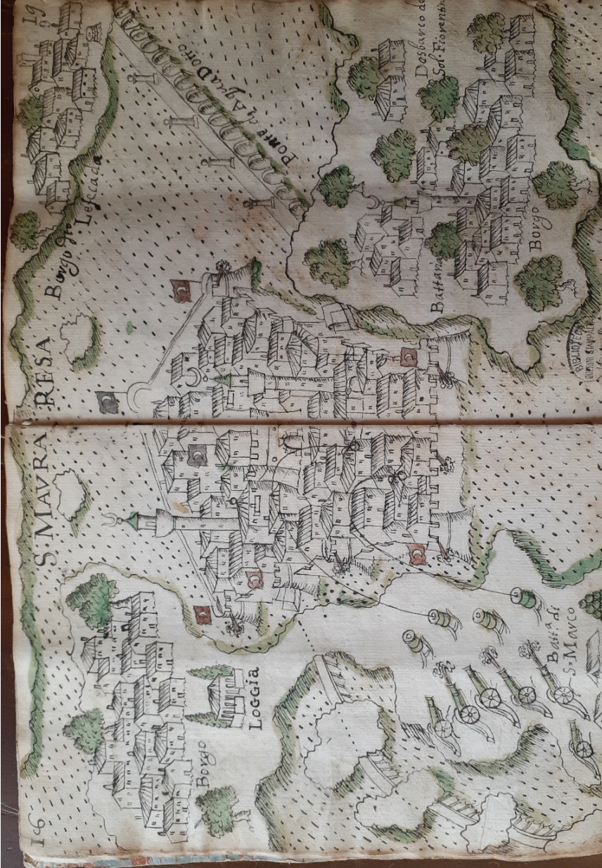
Resim 1 Ayamavra Kalesi