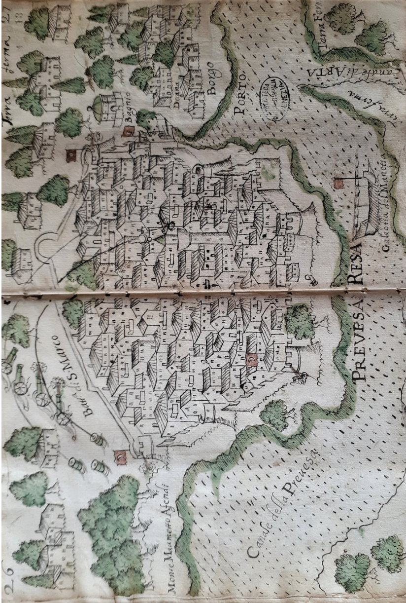
Resim 2 Preveze Kalesi