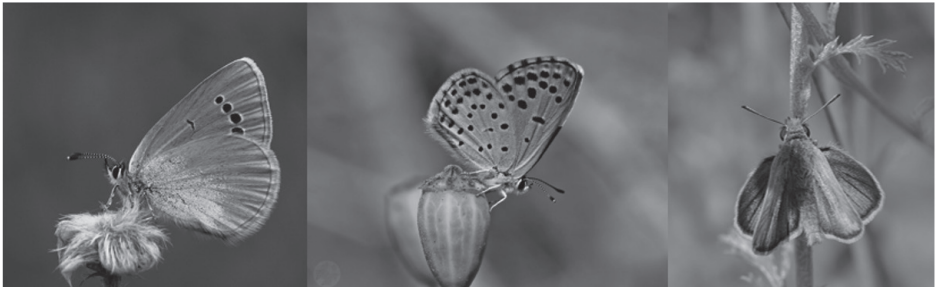
Foto 2. Karagözlü mavi kelebek, himalaya mavi kelebeği, sarı lekeli zıpzıp.

Ekoturizm içinde “kelebek gözlemciliği” de ilgi görmektedir. Türkiye’de kelebek gözlemciliği, gözlemci sayısının internet ortamında fotoğraf paylaşımı ve dijital fotoğraf makinalarının çok sayıda fotoğraf çekmeye olanak tanınmasıyla artmıştır. Kemalpaşa Dağı'nda görülen karagözlü mavi kelebek ( glaucopsyche alexis ), himalaya mavi kelebeği ( pseudophilotes vicrama ), sarı lekeli zıpzıp ( thymelicus acteon ) bölgesel ölçüde tehlike altındadır (Foto 2).