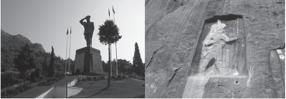
Foto 7. Belkahve Geçidi Atatürk Heykeli ve Karabel Geçidi savaşçı kabartması (Suna Doğaner)

Belkahve ve Karabel geçitlerinin jeopolitik önemini vurgulayan iki anıt bulunmaktadır. Bir anıt Karabel geçidinde M.Ö. 13.yüzyıla, diğeri Belkahve geçidinde M.S.20 yüzyıla aittir (Foto 7). Karabel Geçidi'ndeki anıt, yerel bir kralın yörede hâkimiyetini gösterirken, geçidin jeopolitik önemini de ortaya koymaktadır (Roosvelt,2010). Belkahve Geçidi'nde Atatürk heykeli de aynı şekilde yörede son hâkimiyeti gösterir.