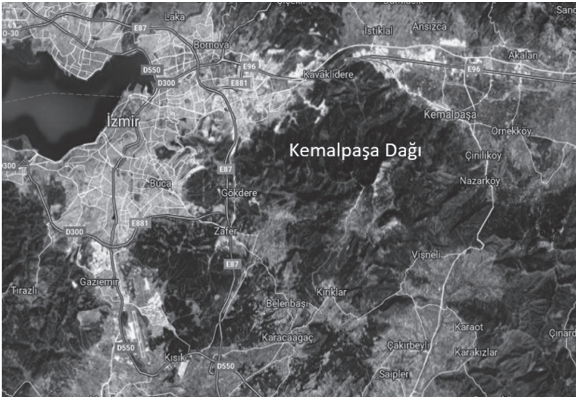
Şekil 1. Kemalpaşa Dağı Konumu

Kemalpaşa Dağı, Ege Bölgesi'nde İzmir Körfezi'nin doğusunda İzmir kentine 20km uzaklıkta, Bozdağlar'ın batı uzantısı üzerindedir (Şekil 1).Bozdağlar'dan Karabel Geçidi'yle (304m yükseklik), kuzeyindeki Yamanlar Dağı'ndan Belkahve Geçidi'yle (245m yükseklik) ayrılır. Dağın batısında Bornova Ovası kuzeydoğuda Kelmalpaşa Ovası güneyde Torbalı Ovası yer alır.