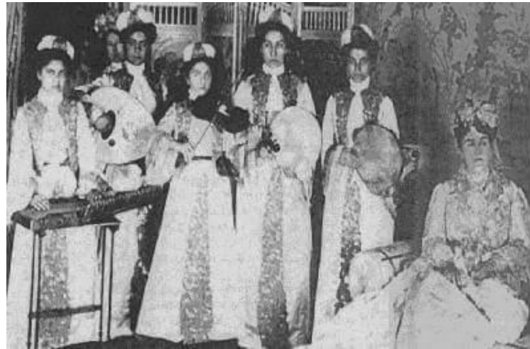
Resim 3 : Kadın Saz Heyeti (1800 lerin sonu)

“Haremdeki Yaşam” adlı kitapta şair Leyla Saz, saray hatırlarının bir bölümünde; Mısırlı Abbas Paşa, 19.yy da yaşamış olan Abdülmecit Han (182-1861)'ın annesi Bezmiâlem Valide Sultan'a takdim edilen kadınlardan oluşan bir saz takımından bahsetmiştir. Bu takım Hacı Arif Bey, Hacı Faik Bey gibi önemli kişilerden meşk etmiş, bir kanun, bir ud, 2 Arap def'i, ile hanendelerden oluşmaktaydı (Saz, 2012: 38) (bkz Resim3).