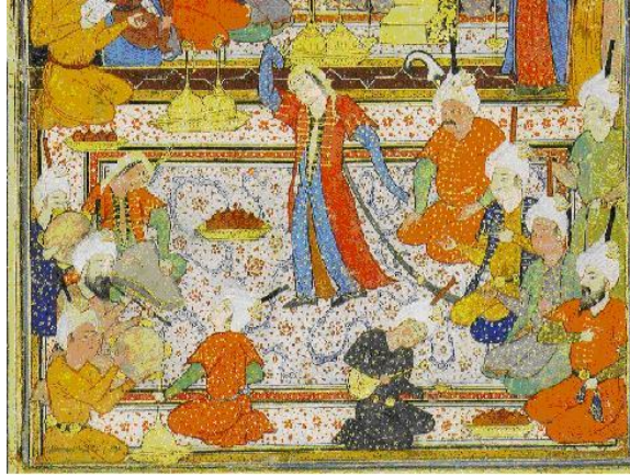
Resim 1 : Timur sarayında bir eğlence kanun çalan kadın kanuni (15.yy)

Minyatürlerde sıkça rastlanan sahne anlayışında, genelde kadınlar şarkı söylemekte, çalgılar çalmakta (çeng, kanun, bendir, daire, rebap, ud, kemençe, ney, kopuz vb), ellerindeki çalpara ile dans etmektedir. Bu minyatürlerden 15. yy da Timur sarayında Timur için düzenlenen bir eğlence sahnesinde çalpara çalan bir rakkaseye, kadın ve erkek müzisyenler eşlik etmekte ve bunlar arasında kanun ve def çalanın kadın olduğu görülmektedir. Bknz Resim 1 (Beşiroğlu, 2017: 144).