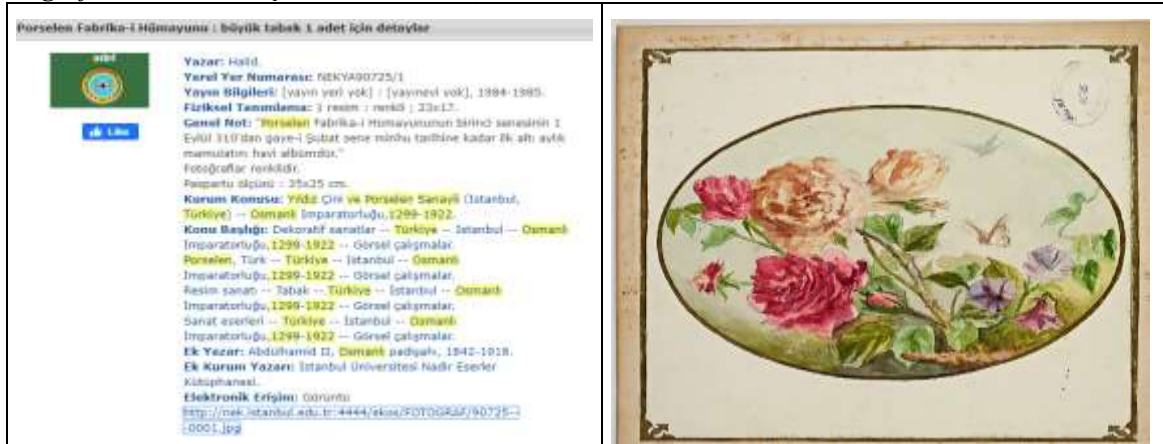
Foto 10. Sultan II. Abdülhamid Han Fotoğraf Albümleri Projesi sonuçlarının yer aldığı Entegre Kütüphane Otomasyon Sisteminden örnek bir ekran görüntüsü.

Sultan II. Abdülhamid Han Fotoğraf Albümleri Projesi Sonuçları: “ Sultan II. Abdülhamid Han Fotoğraf Albümleri Proje çalışması iki etapta gerçekleştirilmiştir; birinci etap kapsamında 45.000 kare ve ikinci etap kapsamında ise 30.000 kare görüntü çekimi yapılarak toplam 75 bin kare görüntü elde edilmiştir. Yaklaşık bir yıl süren proje sonucunda; işlemleri tamamlanan fotoğraflar elektronik ortamdan, İstanbul Üniversitesi Kütüphanesi web sayfası https://kutuphane.istanbul.edu.tr/tr/content/iu-sanal-kutuphaneleri adresinden erişilebilir hale getirilmiştir. Aşağıdaki foto 10’da yer aldığı gibi, otomasyon sistemi üzerinden arama kriterlerine göre herhangi bir fotoğraf arandığında; önce solda görüldüğü şekilde fotoğrafın detaylı bibliyografik künye bilgisi ve künye bilgisindeki yayın linkine tıkladığında sağda görüldüğü gibi fotoğrafın kendisine erişilebilmektedir” (Bezirci, 2020, s.163).