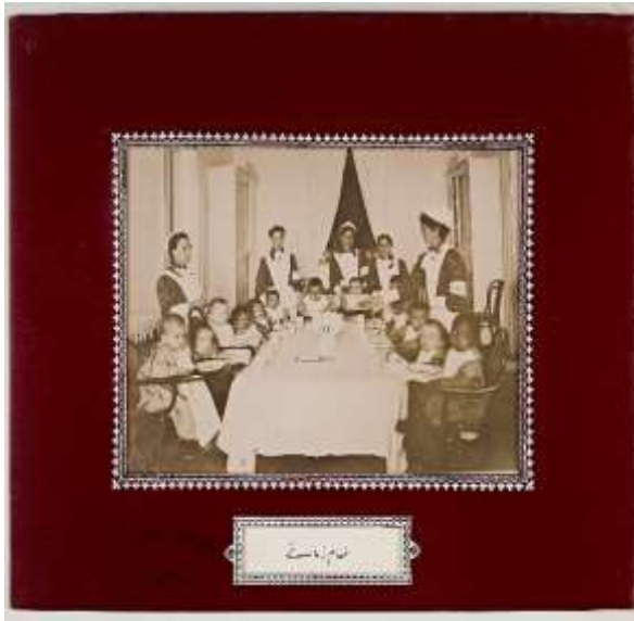
Foto 3. 90609/15, Hamidiye Etfal Hastahane-i Alisi