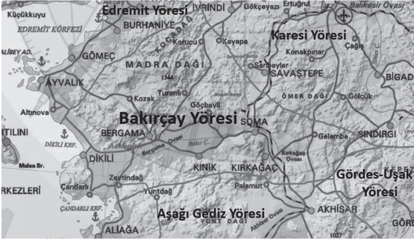
řekil 1. Bakırçay Yöresi Konumu