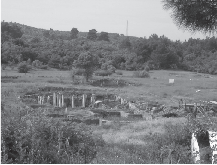
Foto 2. Allianoi, baraj gölü suları altında kalmadan önce(2009,Suna Dođaner)

yerleşmenin Allianoi olduđu sanılmaktadır. Yerleşmenin kuruluş nedeni buradan çıkan 47° C sıcaklıkta sıcak su kaynağıdır. Yerleşme dar bir vadide İlya çayının iki tarafına kuruludur. Roma İmparatorluğu döneminde en parlak dönemini(M.S. 2.yüzyıl) yaşamıştır. Yerleşmenin üçte ikisi kaplıca tesisleridir Bizans çağında son dönemini yaşamış, İlya çayının sel sularının getirdiđi alüvyonlar altında kalmıştır. Sıcak su kaynağı Osmanlılar döneminde de kullanılmıştır. Cumhuriyet Döneminde üzerine bir tesis yapılarak kullanılmış, 1992 yılında Paşa ılıcası binası yenilenmiş, 1998 yılında sel sularıyla kullanılamaz duruma gelmiştir. Ilıcanın batısındaki Roma köprüsü 1979 yılına kadar Bergama-İvrindi arasında kullanılmış, 1992 yılında bozularak yeni bir köprü yapılmıştır.