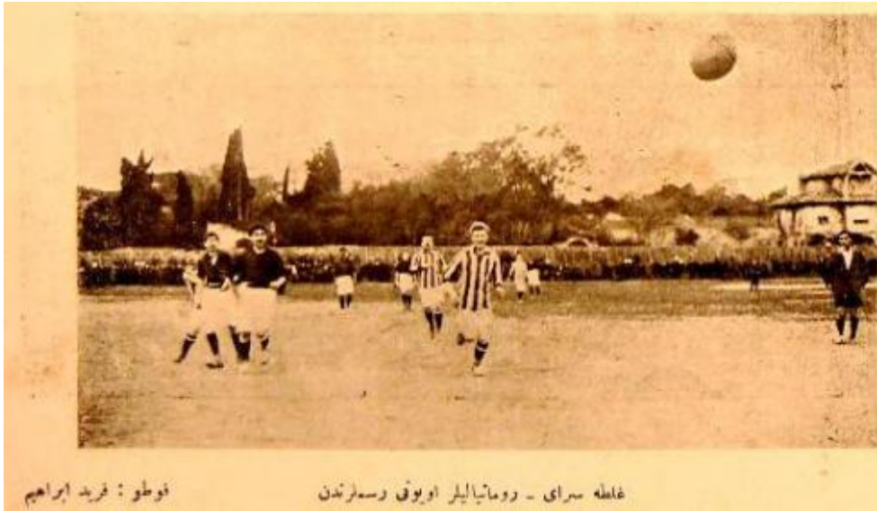
Açıklama: Galatasaray-Romanyalılar oyunu resimlerinden. Foto: Ferid İbrahim. Kaynak: İdman , Numero:29, 21 Nisan 1330 (4 Mayıs 1914), s.457.