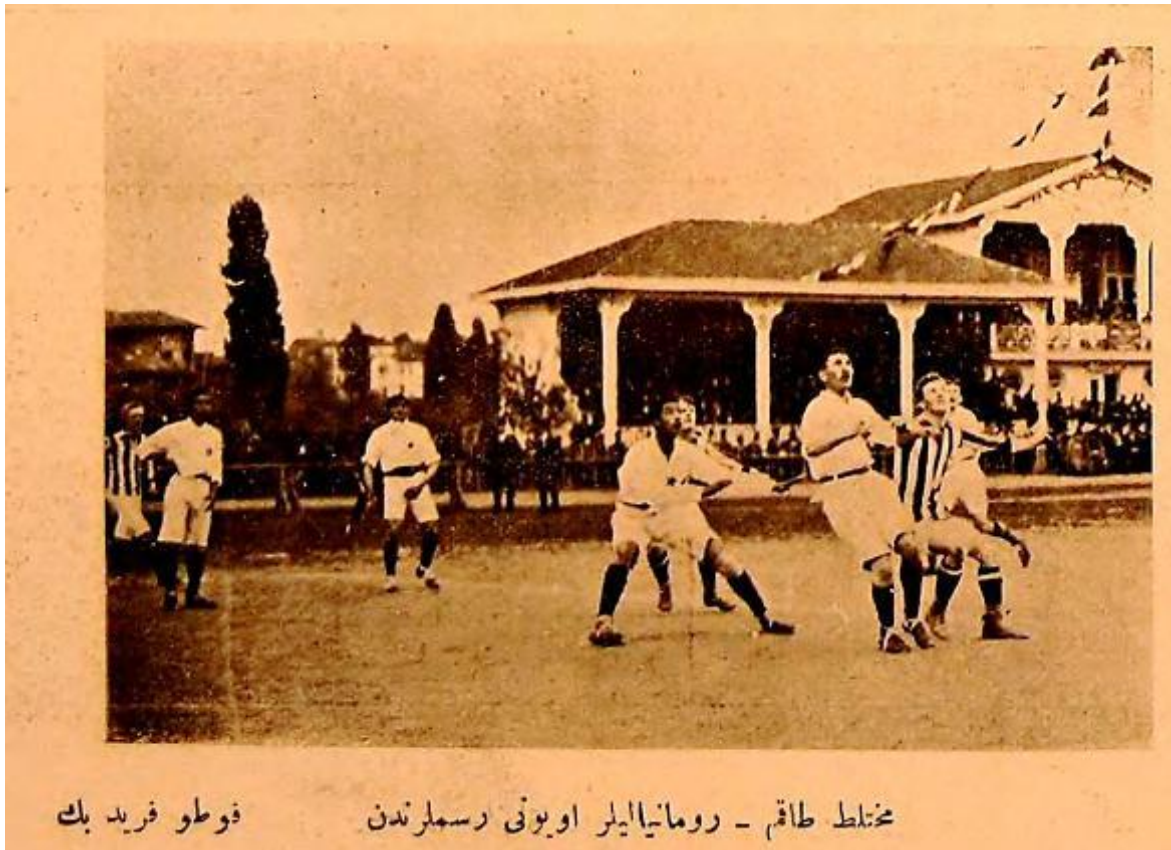
Açıklama: Muhtelit takım-Romanyalılar oyunu resimlerinden. Foto Ferid Bey.

Kaynak: İdman , Numero:28, 14 Nisan 1330 (27 Nisan 1914), s.443.