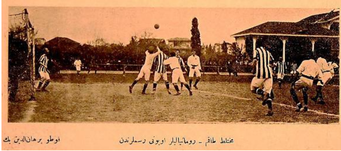
Açıklama: Muhtelit takım-Romanyalılar oyunu resimlerinden.