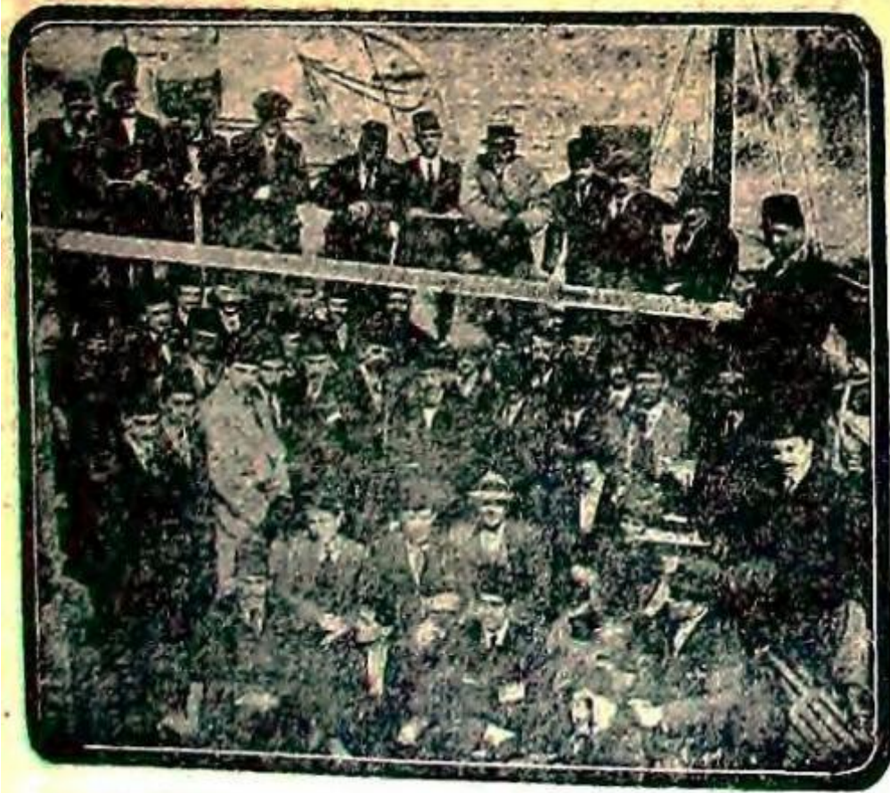
دون رومانيا وابوريله شهر مزه موااسات ايدن رومانيالى ( فوت بول ) طاقنك كنديليرنى استقبال ايدن تورك آرقداشلريله برابر وابورده آلتان رسملى

Ek-1: Romanyalı futbolcuların İstanbul'a gelişlerinde, Romanya vapurunda Türk sporcularla birlikte çekilmiş fotoğrafları.