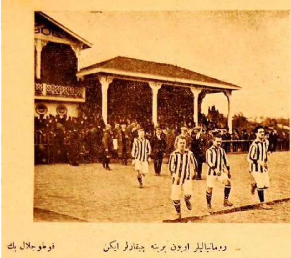
Açıklama: Romanyalılar oyun yerine çıkarlarken. Foto: Celal Bey. Kaynak: İdman , Numero:28, 14 Nisan 1330 (27 Nisan 1914), s.443.