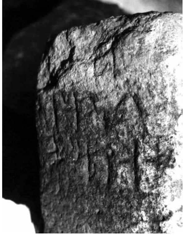
Figür 7. Arami yazıtlı stelin yan cephesi.