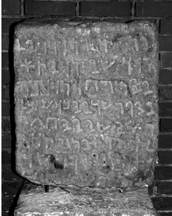
Figür 8. Bahadrlı Aramice Sımr Yazıtı.