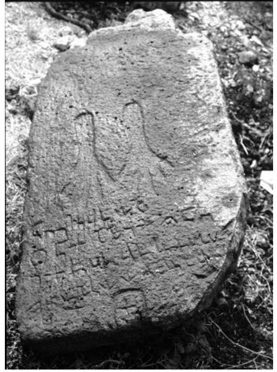
Figür 3. Göller Arami yazıtlı stel.