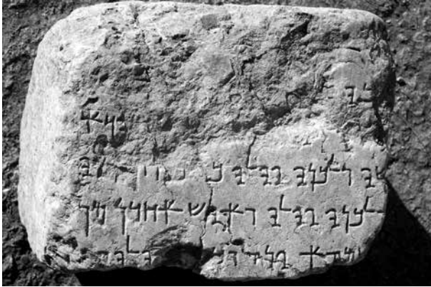
Figür 4. Yumurtalık (Aigeai) İlçesi, Ayvalı Köyü, Arami yazıtlı blok parçası.