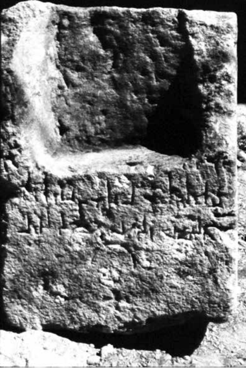
Figür 6. Bozkuyu steli.