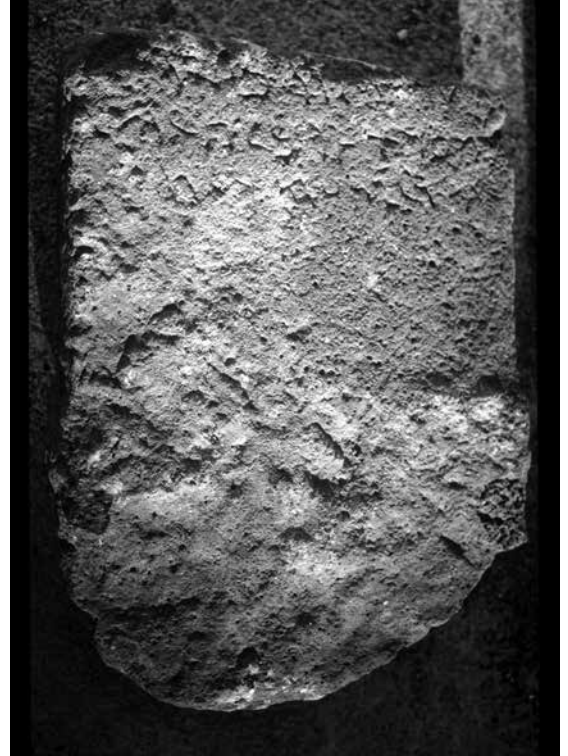
Figür 5. Kırmacılı stelinden genel görüntü.