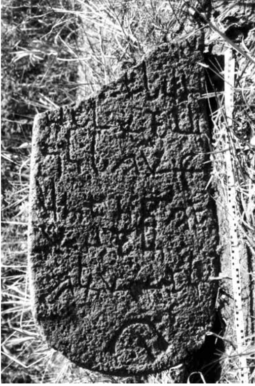
Figür 2. Hediören Mahallesi, Kırmacılı Arami yazıtlı stel.